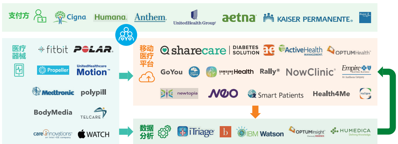
图4：将创新医疗科技应用于疾病管理的各个环节

在技术层面，通过优化管理模式和技术革新，提高管理水平是未来的主要发展方向。在管理模式方面，我国现有的医疗卫生体系更多是以医院为中心，卫生筹资体制与医疗服务的整合（或协调）程度低，在糖尿病管理上缺乏有效、连贯的整合管理模式，以至于不能带来最优化的管理效果（见图4）。