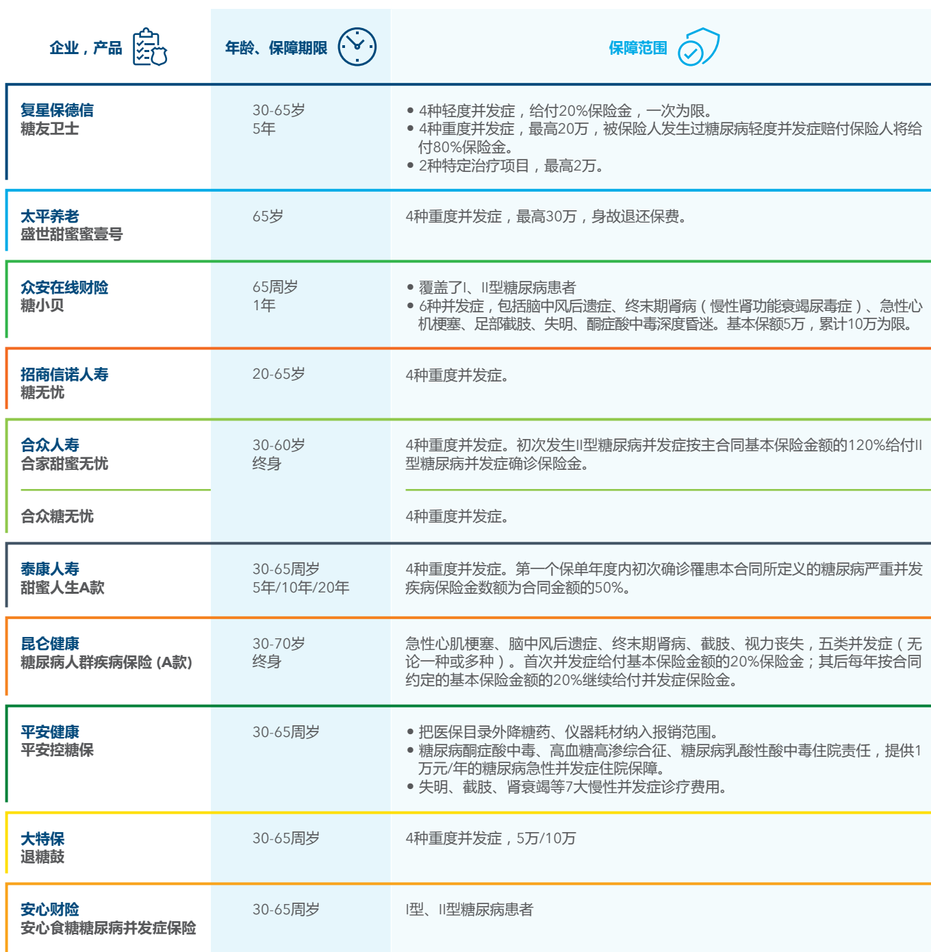
图3：国内糖尿病保险产品概况

理，降低并发症风险，同时也为被普通重疾险拒保的II型糖尿病患者提供重疾类产品（见图3）。